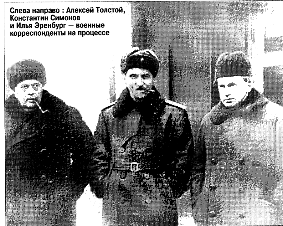
Слева направо: Алексей Толстой, Константин Симонов и Илья Эренбург - военные корреспонденты на процессе

После расстрела ЕАК некоторые советские писатели, выезжавшие на Запад, распространяли ложь, что его члены живы-здоровы и продолжают трудиться. В числе их оказался и Эренбург. Застыгнутый врасплох вопросом о судьбе Ицика Фефера и Давида Бергельсона на импровизированной пресс-конференции в Лондоне в 1950 году, Эренбург ответил, что если бы с ними что-либо произошло, то это наверняка было бы ему известно. Ложь есть ложь, но скажи Эренбург правду, это уже никак не помогло бы уничтоженному ЕАК и повлекло бы уничтожение писателя и его семьи.