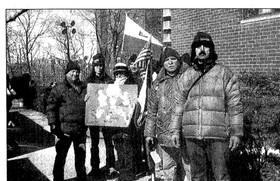
Бастующие настроены решительно

моря на то что неоплаченные счета за медицинские услуги были переправлены владелице дома для престарелых, ни один из них не был ею погашен. Мы, бастующие, жалуемся на несправедливое отношение владелицы к своим сотрудникам, на занижение ее зарплаты, на желание вкладывать дополнительные средства в ремонт и переоборудование дома для престарелых, в результате чего страдают пациенты – старые больные